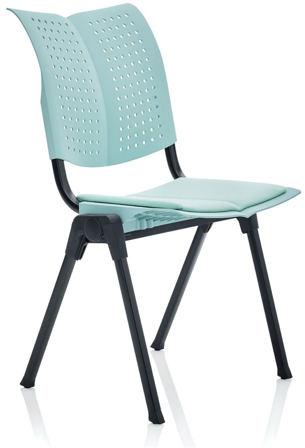
Design: Peter Opsvik. Patent- und Designgeschützt.